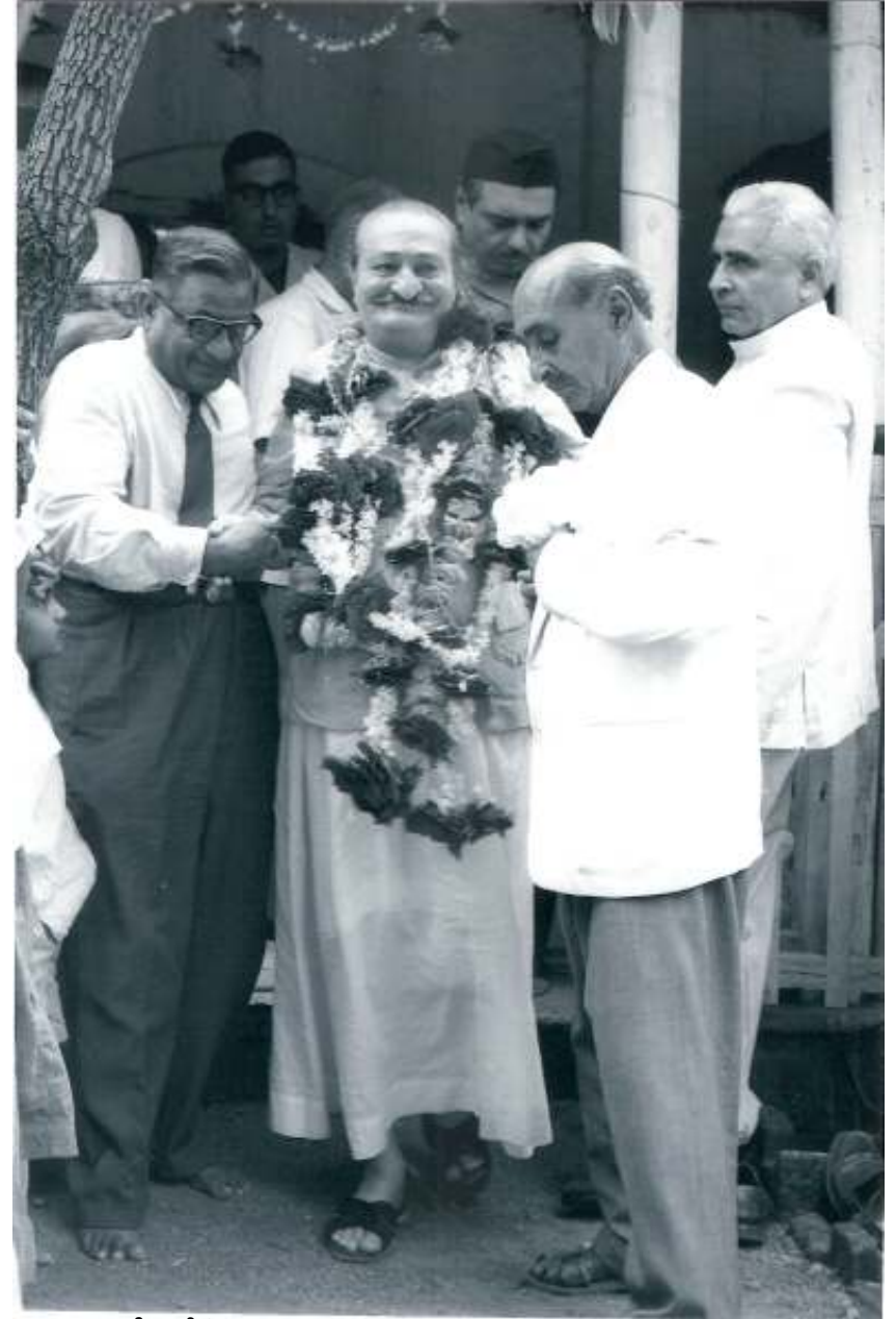
అవతారునితో ధాకేజీ.

1926 ప్రాంతంలో, ఒక సందర్భంలో మెహెర్బాబాను భగవంతునిగా అంగీకరించనని ధైర్యంగా I would not accept Baba as God అని బాబా ఎదుటనే చెప్పానని ధాకే వివరించారు.