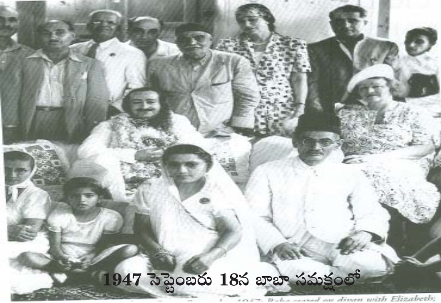
1947 సెప్టెంబరు 18న బాబా సమక్షంలో