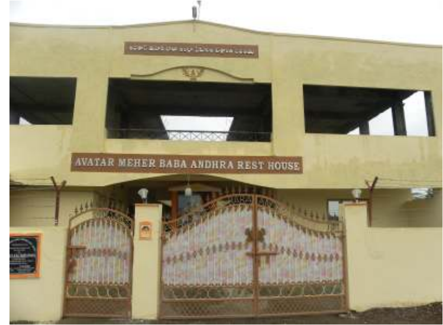
మెహెరాబాద్ లో బాబా ప్రేమికులకు చక్కని ఆతిథ్యం ఇస్తున్న ఆంధ్రా రెస్ట్ హౌస్.