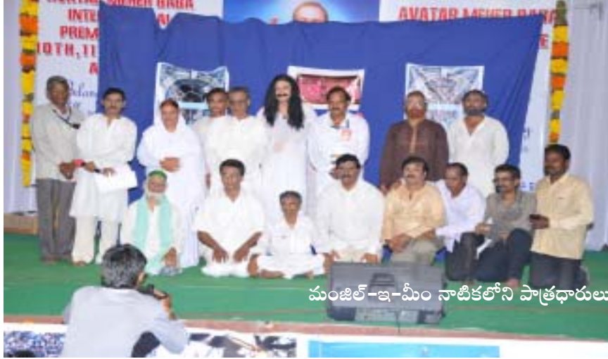
మంజిల్-ఇ-మీం నాటికలోని పాత్రధారులు